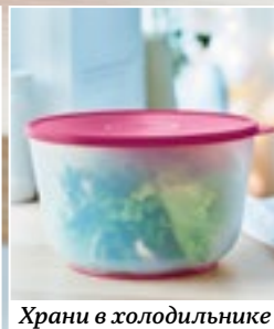
Храни в холодильнике