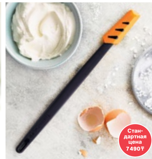
Силиконовый скребок малый

РАЗМЕСТИ ЗАКАЗ НА СУММУ 60 000 ₸ И ПОЛУЧИ ОБА ПОДАРКА!*