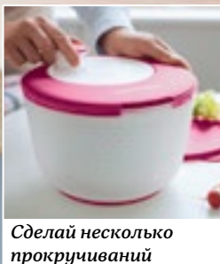
Сделай несколько прокручиваний