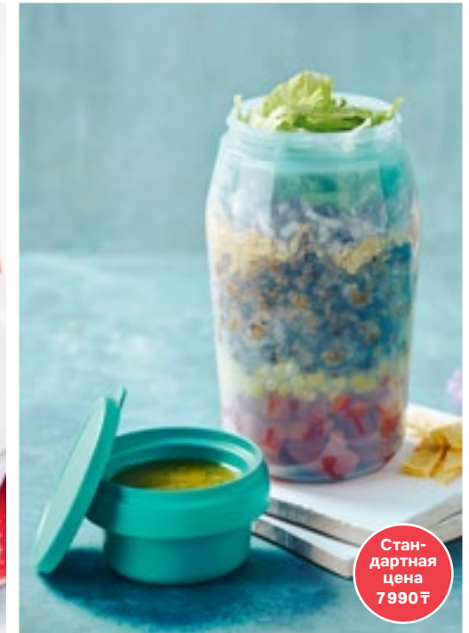
«Браво-Дилайт» (430 мл)