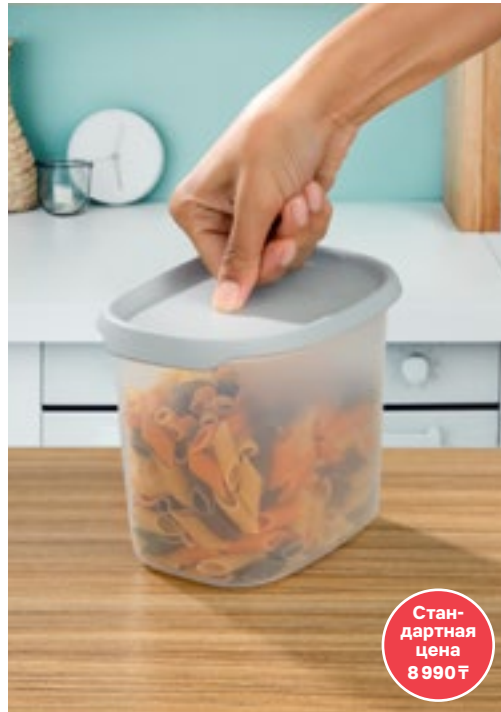
Контейнер «One Touch Fresh» (540 мл) Контейнер «One Touch Fresh» (1,1 л)