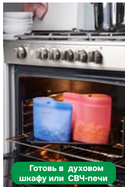
Готовь в духовом шкафу или СВЧ-печи