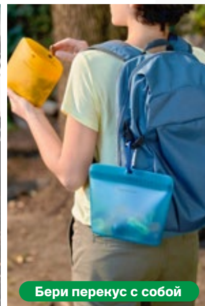
Бери перекус с собой