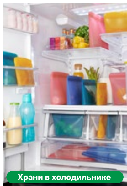
Храни в холодильнике