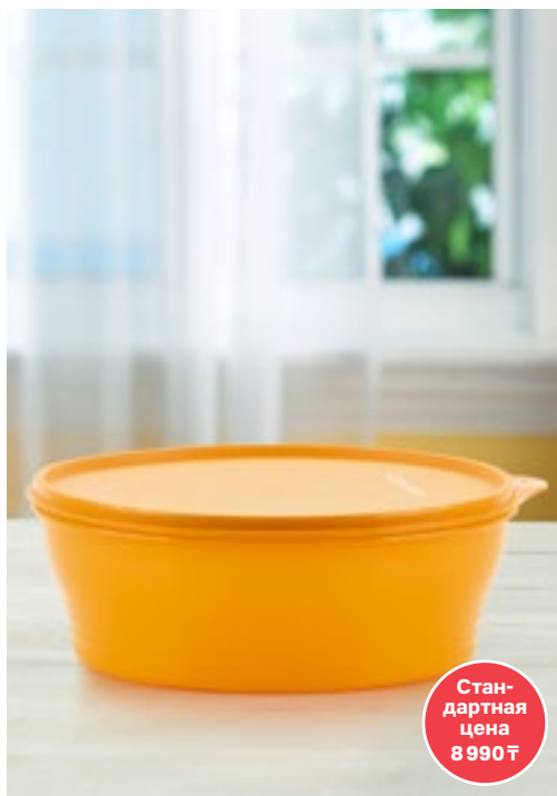
Чаша «Новая классика» (1 л)